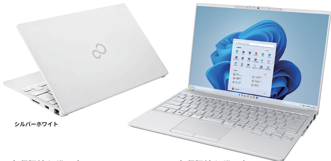
シルバーホワイト